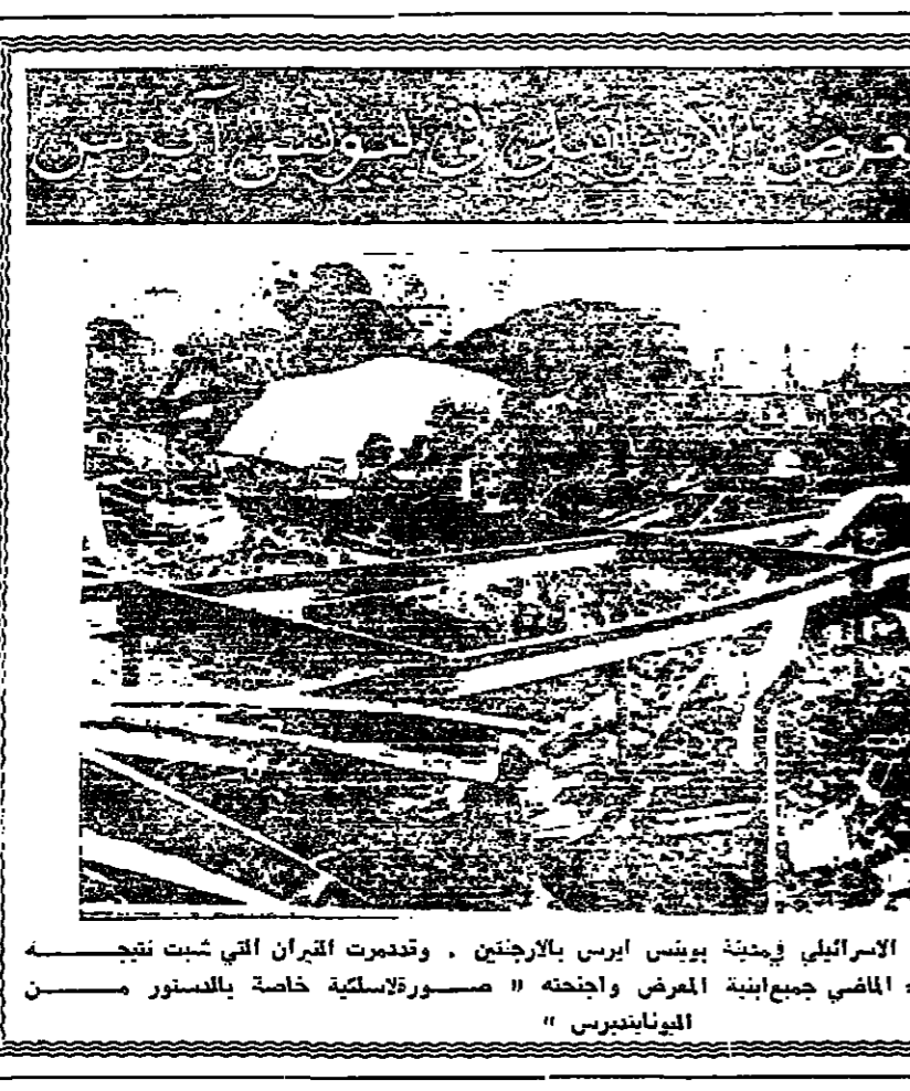
شهد ليليا المعرض الإسرائيلي في مدينة بوليس ايرس بالاردن . وتقدمت القرائن التي شبت نتيجة انفجار قبلة يوم الاربعاء الماضي جميع ابنية المعرض واجتذبه «صوره لاسلعية خاصة بالسنور من اليونانيس»

نيويورك - رويتر - نكرت صحيفة (نيويورك تايمز) أمس ان الاتحاد السوفياتي عرض على الولايات المتحدة سرا قبل اسبوعين حلا وسطا للسلام في الشرق الأوسط . وقالت الصحيفة في نيا مصدرها واشنطن نشرته في صفحتها الأولى نقلًا عن مسؤولين حكوميين من الولايات المتحدة درسوا الآن المشروع السوفياتي الذي يهدف إلى إنهاء التوتر العربي الإسرائيلي على الصفحة الخامسة عمود ٧ إسرائيل رفضت المشروع والمخوة لا علم لها به موقف المتحدة موقف إسرائيل القاهرة - عقب الدكتور محمد حسن الزيات الناطق الرسمي باسم الجمهورية العربية المتحدة على ما ذكرته صحيفة (نيويورك تايمز) في عددها الصادر صباح أمس بأن الحكومة الأمريكية الآن اقترحتا سوفييتا لحلال السلام في الشرق الأوسط فقال انه لا علم لبلاده بهذا الاقتراح السوفياتي وذلك فقه لا يمتحنها ان تعبر عن رأيها فيه . وقال الناطق المصري ان العلاقات بين مصر والاتحاد السوفياتي ودية للغاية بحيث انها ليست بحاجة الى ابناء من واشنطن حول تولابا مونتكو . باريس - رويتر - رفض ابا ابيان وزير خارجية إسرائيل أمس خطة للتسوية السلمية بين العرب وإسرائيل ونكر ان الاتحاد السوفياتي عرضها . وكان ابيان يتحدث إلى الصحفيين بعد ان أجرى مشاورات مع المسعود ميشيل دوبريه وزير الخارجية الفرنسية وقال ابيان ان لا جديد في الخطة السوفياتية . وأضاف يقول ان هذه الخطة تشبه خطة عرضها الاتحاد السوفياتي على مجلس الأمن في ٢٢ تشرين الثاني من السنة الماضية وقد رفضها إسرائيل وأغلبية الحكومات الأخرى . وقال ابيان ان خطة السلام السوفياتية الجديدة تدعو إلى انسحاب إسرائيل القبية على الصفحة الرابعة عمود ٢